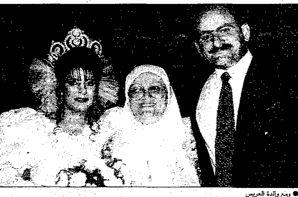
● ومع وادة العريس